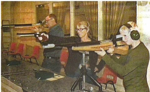
Leden van de schietvereniging

In het begin waren we de enige schietvereniging in Oostelijk Flevoland. Daar zijn we best trots op. We streven onze idealen na, dat betreft het behalen van resultaten bij de wedstrijden. Maar dat hoeft niet, ook recreatief sporten vinden we belangrijk. En het onderhouden van het gebouw hoort erbij. Onze sport is een goede aanvulling op het sportaanbod in Biddinghuizen."